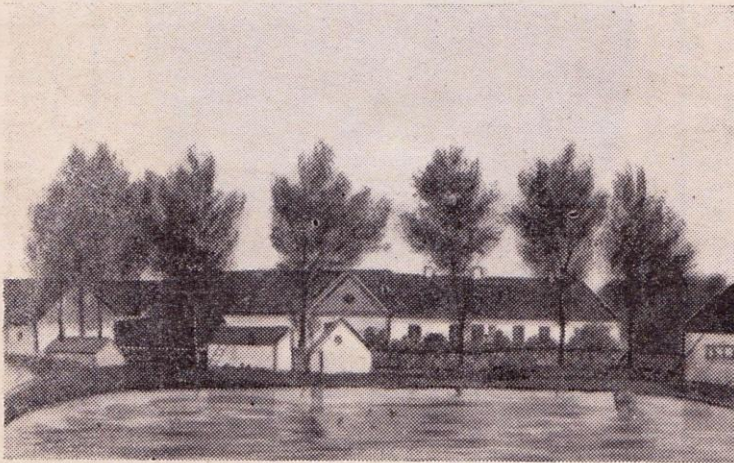
PARTI AF DEN GAMLE GAARD FØR BRANDEN, SET FRA — NORDØST MED GADEKÆRET I FORGRUNDEN —