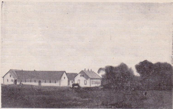
GAARDEN EFTER BRANDEN